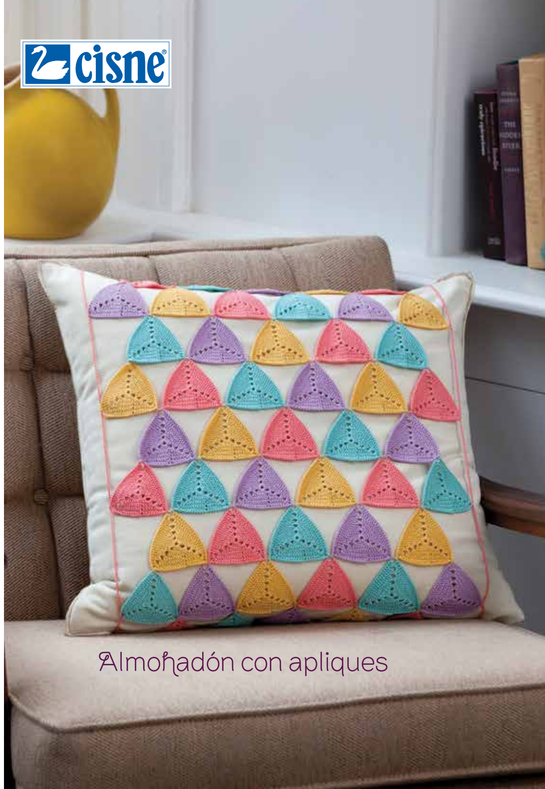
Almohadón con apliques